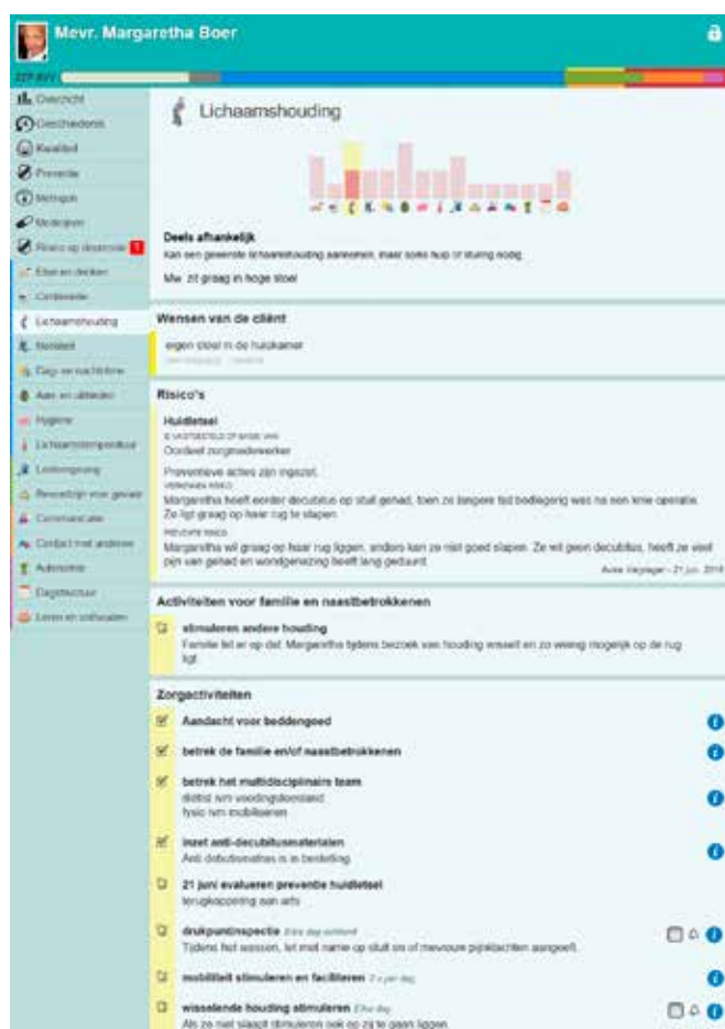
Afbeelding 2. Voorbeeld van een zorgplan waarvan de basisbehoefte lichaamshouding wordt getoond. Je ziet een selectie van de preventieve zorgactiviteiten uit het zorgpad decubitus waarover afspraken zijn gemaakt met cliënt en zijn naasten, om decubitus te voorkomen. Achter de 'i' staat meer informatie over de preventieve actie: zie afbeelding 3